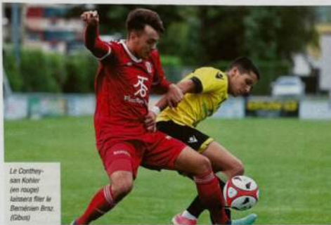
Le Conthey-sien Kohler (en rouge) laisse filer le Bernésien Brnz (à gauche).

Victorieux de leurs deux premiers matchs, les Contheysans, qui ont bénéficié d'occasions, se sont inclinés samedi aux Fougères 1-0 face à Signal-Bernex.