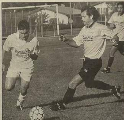
Bernésiens et Jeannois ont constamment pensé à jouer. Une bouffée d'oxygène après les quelques «dérapages» constatés sur les stades genevois.