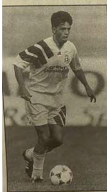
Carouge pourra-t-il compter sur Morisod?

COUPE DE SUISSE / Derby sur le coteau où Signal reçoit Etoile Carouge aujourd'hui à 17 h 30. De son côté, Grand-Lancy affronte Chênois dimanche à 10 h.