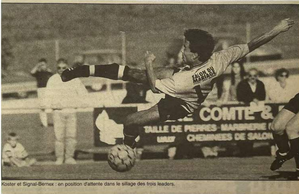
Koster et Signal-Bernex : en position d'attente dans le sillage des trois leaders.