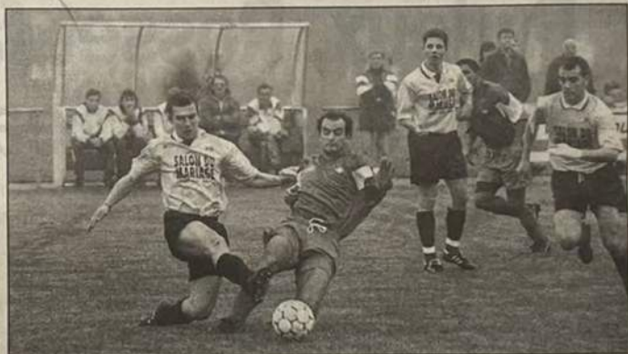
Après les derbys en première ligue, Signal et UGS se retrouvent dans la série inférieure. Pas forcément avec les mêmes ambitions...