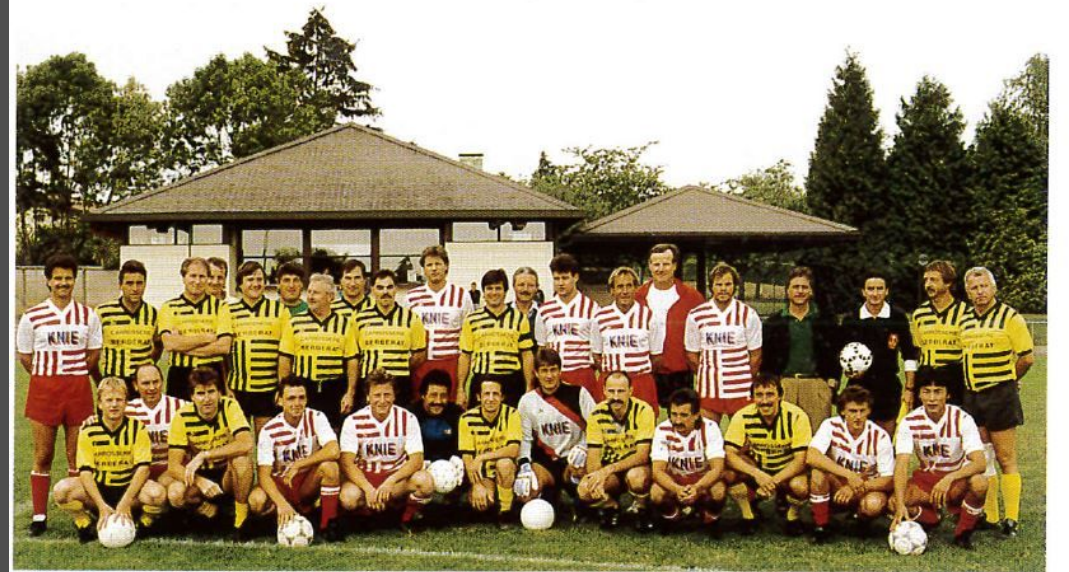
Match contre l'équipe du Cirque Knie en 1990