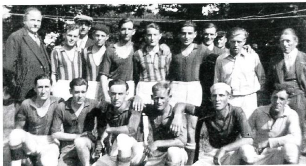
1 re équipe Saison 1935/1936 - Champion genevois

Les débuts du jeune club furent encourageants: pour sa première saison, il se classa deuxième de son groupe.