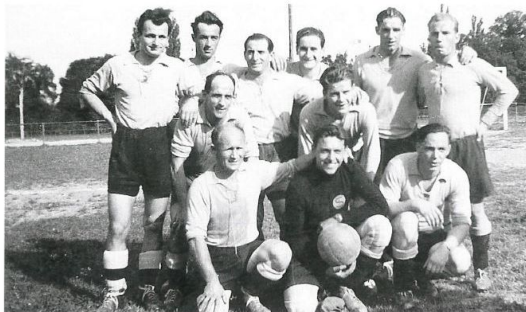
1 re équipe Saison 1947/1948

La guerre, hélas, vint interrompre la marche ascendante du club, qui suspendit son activité de 1940 à 1946.