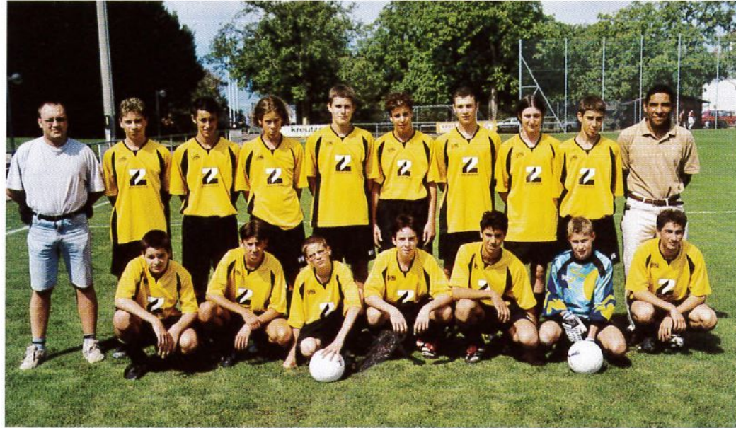
Juniors A Saison 2000/2001