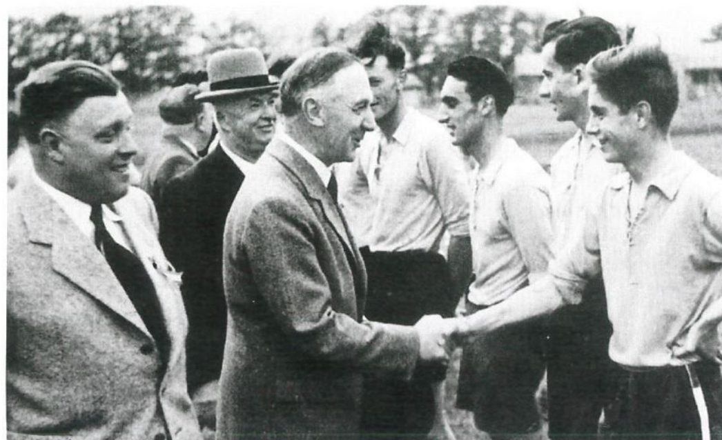
Le 25 e anniversaire du club, à Bernex, les 9 et 10 juillet 1949

C'est donc dans la liesse que le Signal F.C. fêta, les 9 et 10 juillet 1949, son 25 e anniversaire, en présence des autorités des trois communes de Bernex, Onex et Confignon, avec le concours du Gardy-Jonction, du Montreux-Sports et des clubs français C.S. Persan (Paris) et A.S. Beaune.