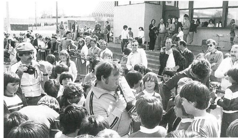
L'Ecole de football: Tournoi Juniors, à Bernex, en 1982 et départ pour le tournoi de Zurich