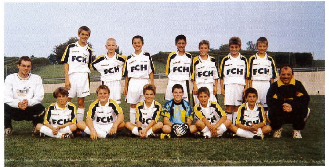
Juniors B Saison 2000/2001