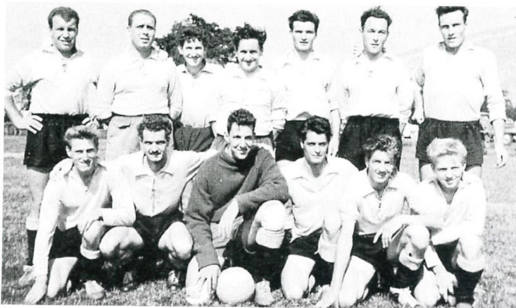
1 re équipe Saison 1958/1959

Champion III e ligue, promu en II e ligue