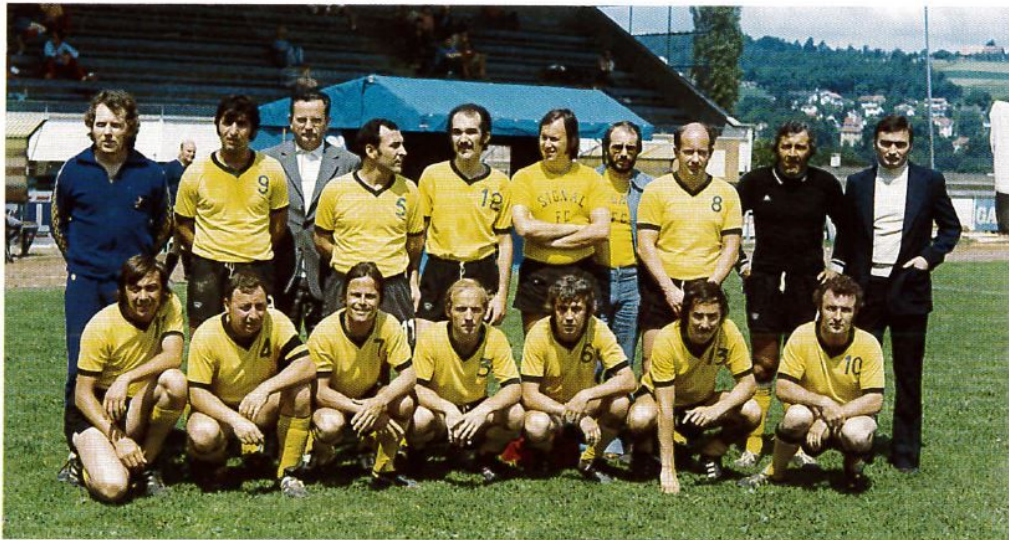
L'équipe des Vétérans Saison 1973/1974

Si le nombre de joueurs devenant actifs et pouvant évoluer avec notre première équipe restait encore faible, nous devons admettre que la section juniors jouait très bien son rôle et que le travail en profondeur accompli par les responsables était parfaitement dans la ligne tracée par nos aînés.