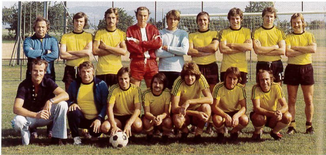
1 re équipe Saison 1976/1977