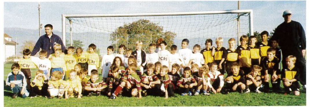
Ecole de football Saison 2000/2001

A l'aube de cette nouvelle étape du Signal F.C. qui nous amènera au 100 e anniversaire, souhaitons que les jeunes prennent la relève et connaissent aussi avec les joueurs et supporters les moments de joie qui ont marqué les septante-cinq premières années du club,